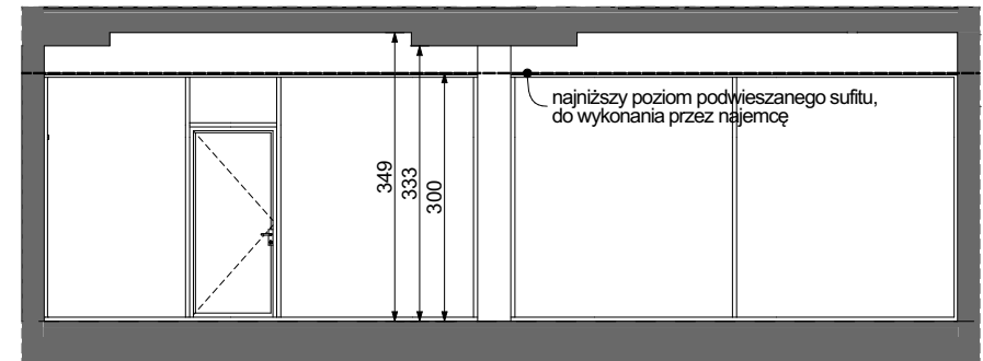
PRZEKRÓJ "A-A" PRZEZ LOKAL USŁUGOWY