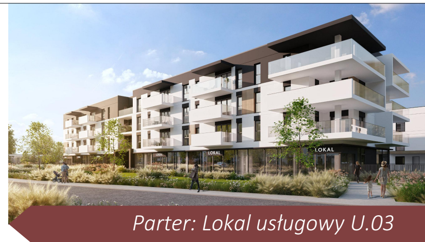
Parter: Lokal usługowy U.03