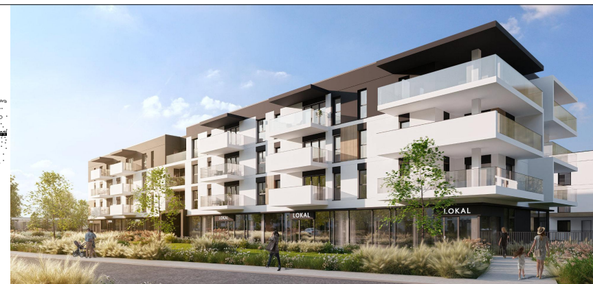
Parter: Lokal usługowy U.01