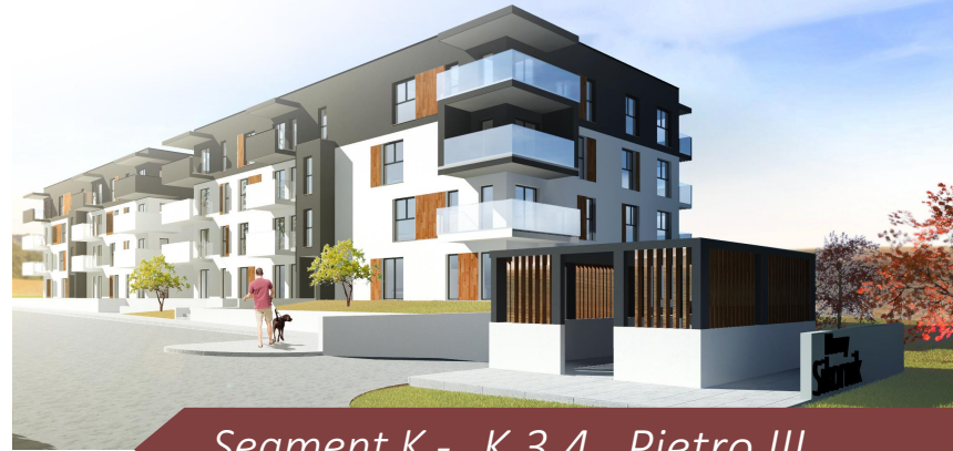
Segment K - K.3.4 Piętro III