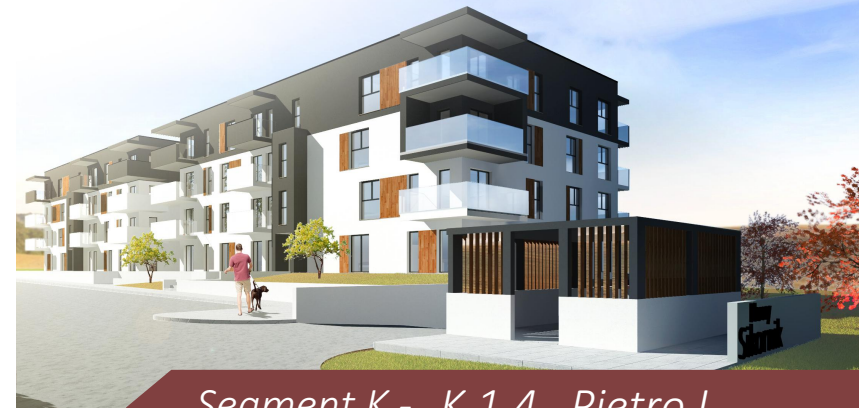
Segment K - K.1.4 Piętro I