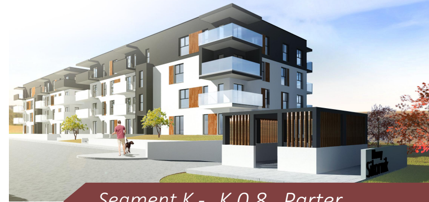
Segment K - K.O.8 Parter