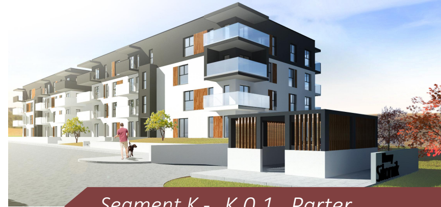
Segment K - K.O.1 Parter