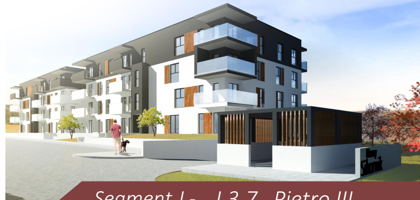
Segment J - J.3.7 Piętro III