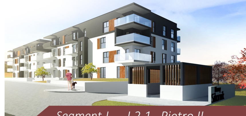
Segment J - J.2.1 Piętro II