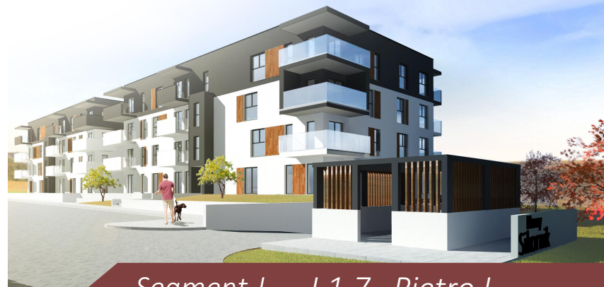
Segment J - J.1.7 Piętro I