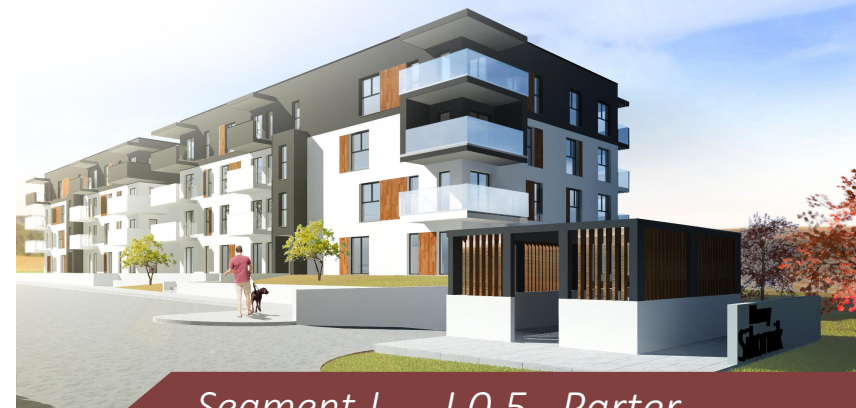
Segment J - J.0.5 Parter