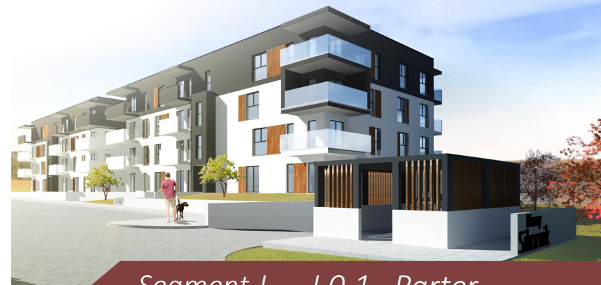
Segment J - J.O.1 Parter